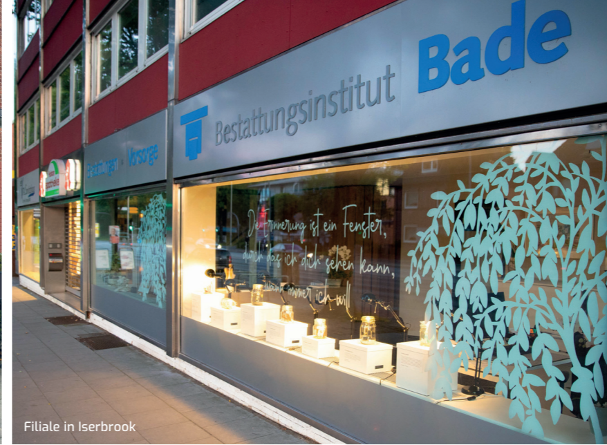
Filiale in Iserbrook

Unser Institut ist eines der ältesten Unternehmen seiner Branche im Kreis Pinneberg und den Elbvororten.