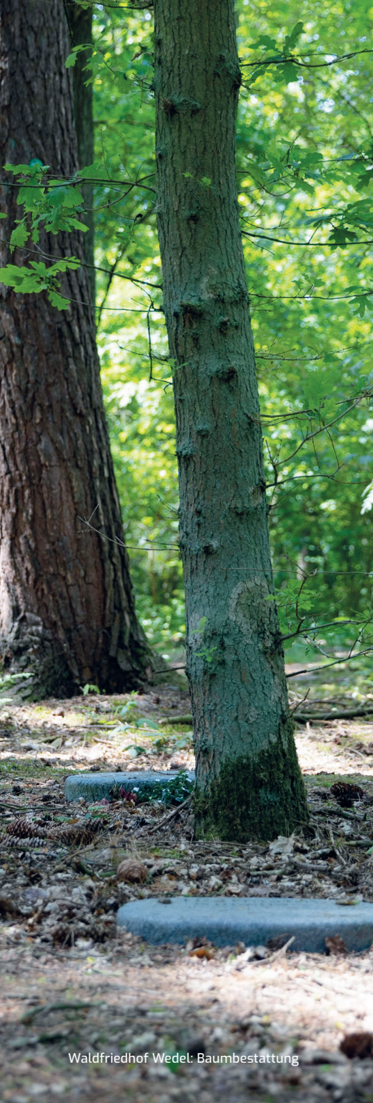
Waldfriedhof Wedel: Baumbestattung