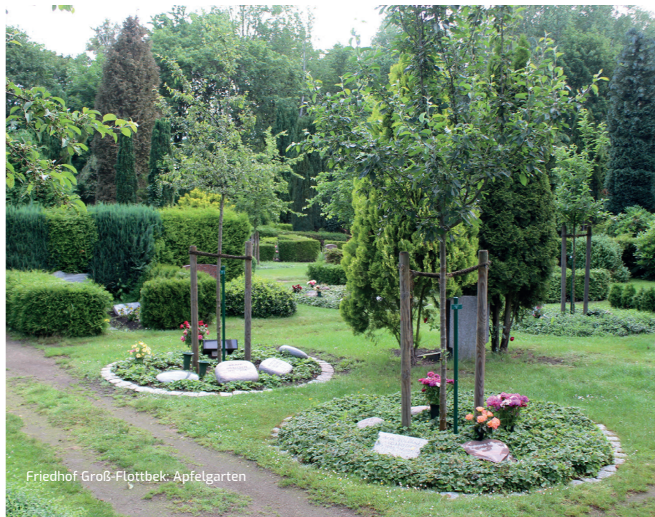
Friedhof Groß-Flottbek: Apfelgarten