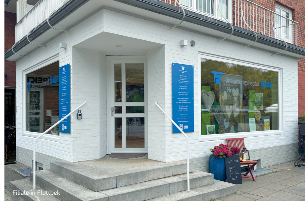
Filiale in Flottbek