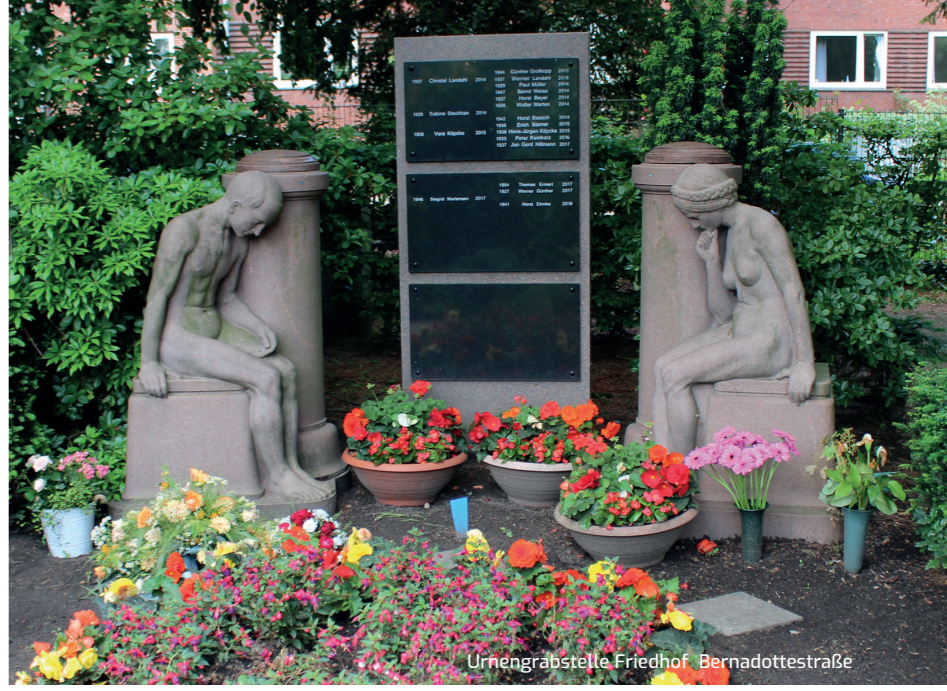
Urnengrabbstelle Friedhof Bernadottestraße