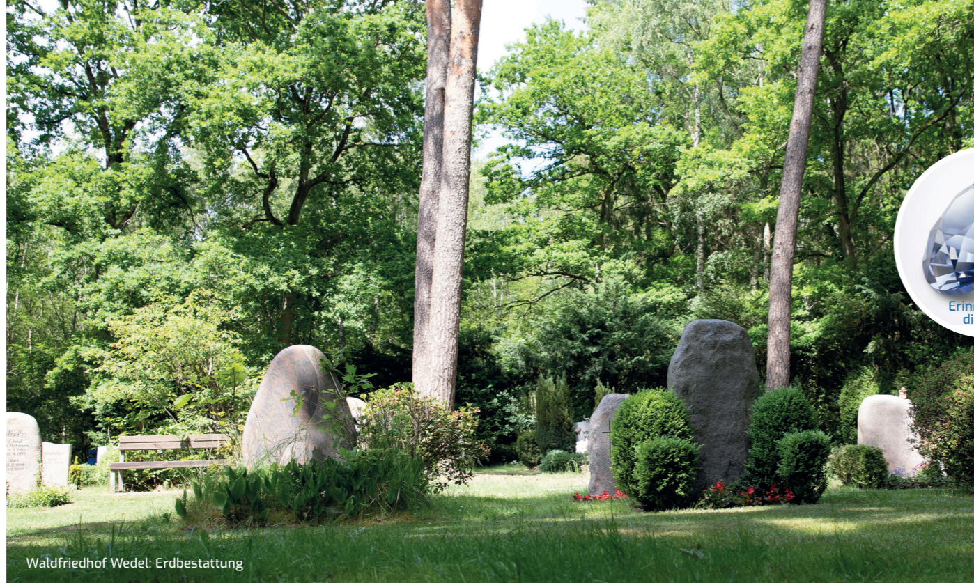
Waldfriedhof Wedel: Erdbestattung

Ein Erinnerungsdiamant ist eine ganz persönliche Art zu trauern - und Erinnerung zu bewahren. Bei Interesse informieren wir Sie gerne in einem persönlichen Gespräch.