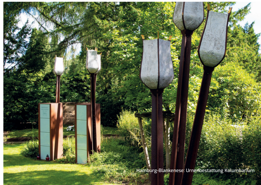
Hamburg-Blankenese: Urnenbestattung Kolumbarium